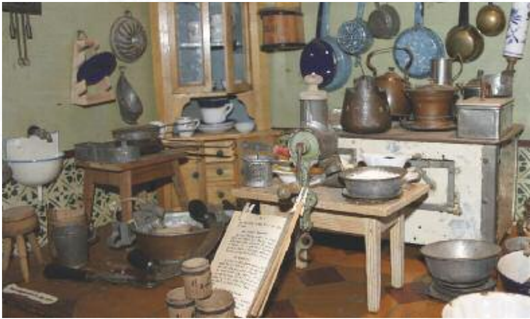
oben: Früh übt sich, wer gute Spätzle machen will. In der Puppenküche von 1870 finden sich eine funktionsfähige Spätzlepresse (links vorne auf dem Tisch) und ein Kochbuch mit Spätzlerezept. rechts: Es gibt hier doch tatsächlich einen katholischen (links) und evangelischen Spätzleobel.