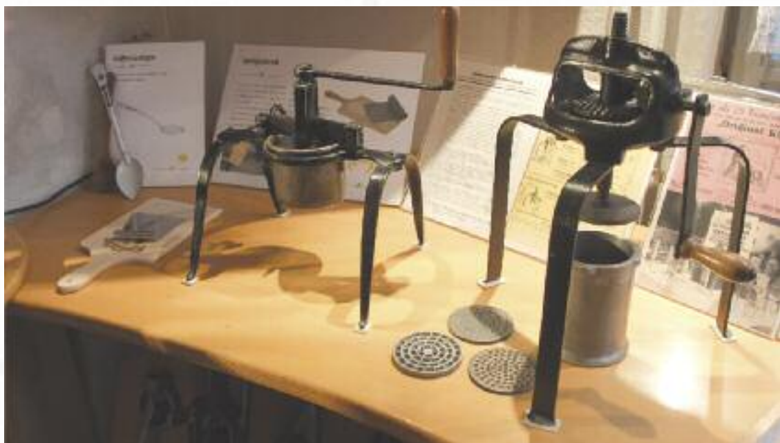
Eine runde Sache: Im rund 500 Jahre alten Vötschenturm in Bad Waldsee hat Deutschlands erstes Spätzlemuseum dank Heidi Huber seine Heimat gefunden.